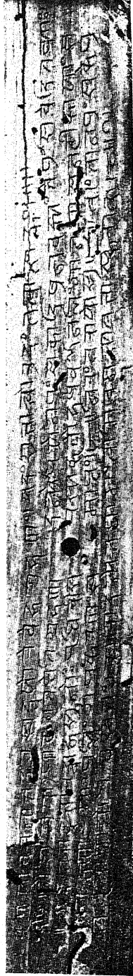
Līṅgānuśāsana Manuscript from Madras. In Nandi-nāgarī Script.